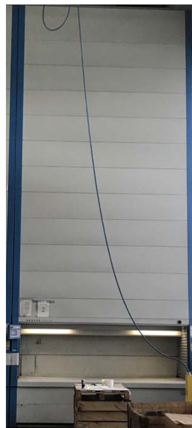
Vista macchina allo stato d'uso precedente

(*) In caso di interruzione prima di 8 mesi di noleggio, sarà dovuto un forfait di 13.000,00 eur + IVA per l'ammortamento delle spese di smontaggio e ritiro.